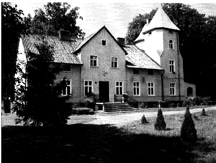
Fot. 1. Pałac z XIX w.

Najbardziej reprezentacyjną częścią dawnego folwarku jest dość dobrze utrzymany i zadbane przez obecnych właścicieli dwór. Powstał on około połowy XIX wieku, a następnie został przebudowany i rozbudowany na początku XX wieku i w roku 1933, o czym świadczy jego ogólna konstrukcja, różnej grubości mury czy stylowa romańska wieża.