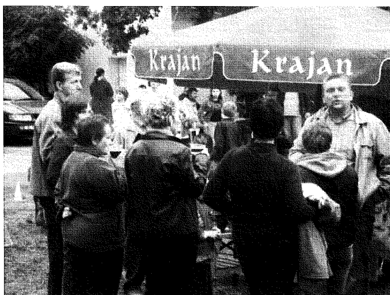
Fot. 7.8.9. Mieszkańcy wsi