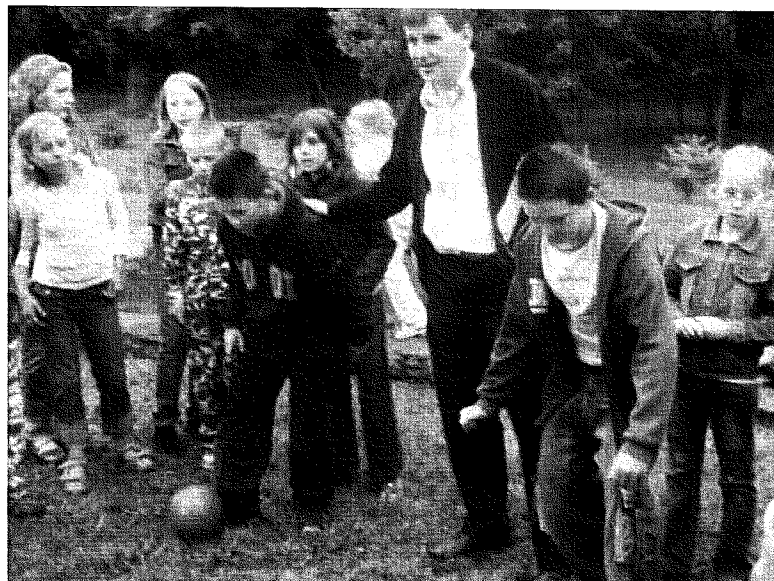
Fot. 10. Gry i zabawy dla dzieci