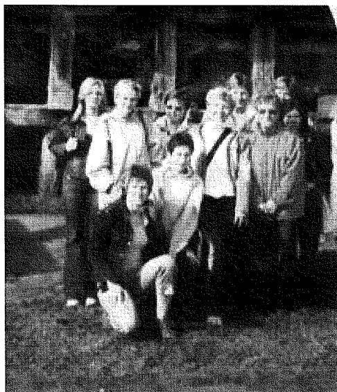
Fot. 15. Zdjęcie z wycieczki do Ciechocinka

Koło Gospodyń Wiejskich w Matyldzinie, zostało założone w dniu 27.01.2003 r.. Koło liczy 14 osób. Panie z koła gospodyń organizują różnego rodzaju spotkania, m.in. Dzień Kobiet, Dzień Dziecka, grill. Do kalendarza imprez gminnych na stałe wpisała się impreza z cyklu „Z wizytą u sąsiadki – Święto Pieczonego Ziemniaka”. Panie organizują także wycieczki, uczestniczą w imprezach takich jak Rościminiada, Dożynki Gminne.