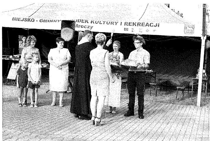
Fot. 13, 14 – Dożynki sołectwa Matyldzin