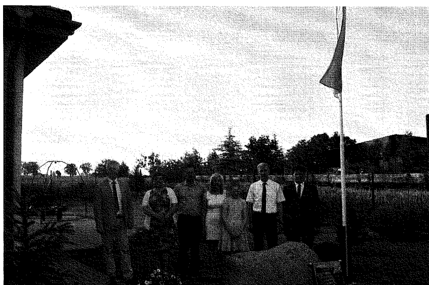
Fot. 11, 12 - Nadanie loga sołectwu Matyldzin – 4.06.2016r.