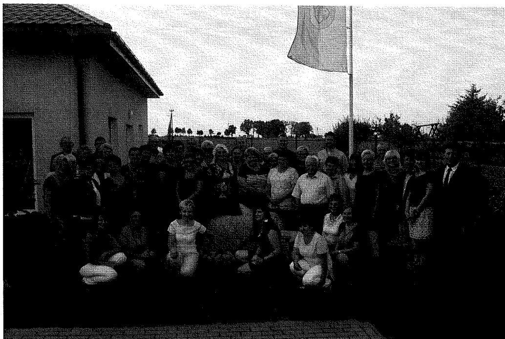
Fot. 16. Święto Pieczonego Ziemniaka -17.09.2016r.