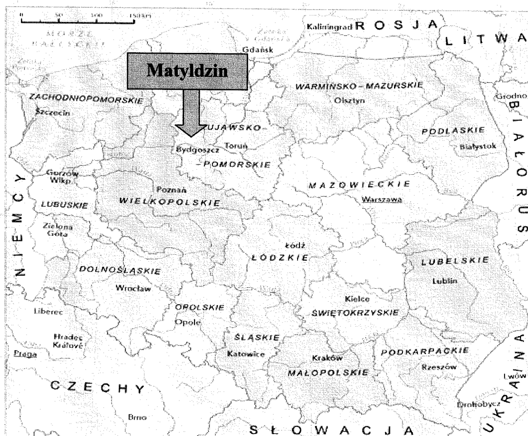
Mapa 1. Położenie Matyldzina na tle kraju i województwa

Matyldzin położony jest w województwie kujawsko-pomorskim, powiecie nakielskim w południowo - zachodniej części gminy Mrocza. Graniczy z sołectwem Wyrza, Białowieża, Kaźmierzewo i Krukówko.