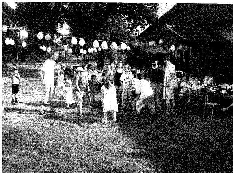
Fot. 4. Gry i zabawy dla dzieci