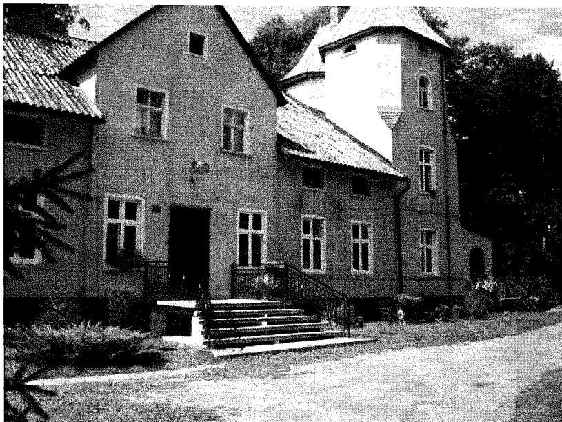
Fot. 2. Pałac XIX w.