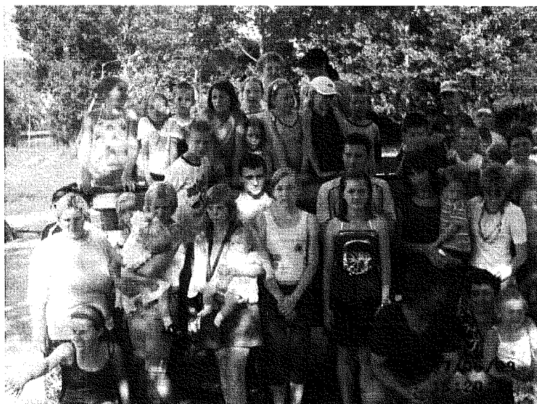
Fot. 3. Zdjęcie grupowe dzieci z rodzicami.