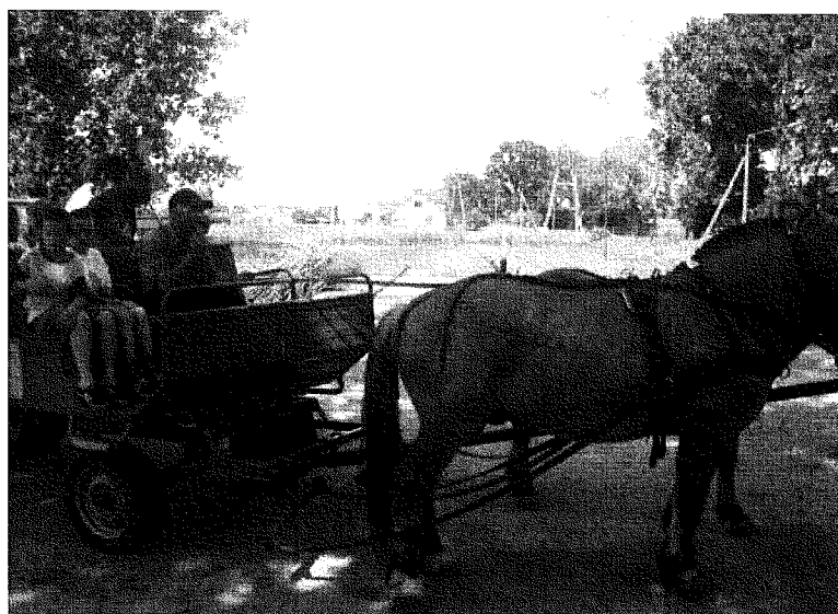
Fot. 5. Przejazd bryczką